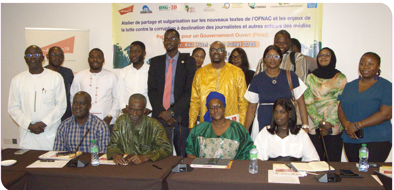
Photo illustrative des participants à l’atelier