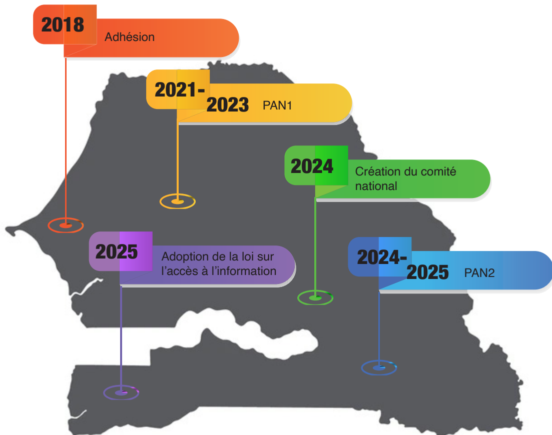
Une frise chronologique (2018–2025) retraçant les étapes clés du PGO au Sénégal :

À partir de 2023, une nouvelle étape s’est ouverte avec l’adoption du deuxième Plan d’Action National (2023–2025) , qui a redéfini les priorités autour de huit (8) engagements clés. Ces engagements couvrent l’accès à l’information, la transparence budgétaire, la lutte contre la corruption, la digitalisation des services publics ainsi que le budget participatif. Le plan constitue aujourd’hui la colonne vertébrale de la politique nationale du gouvernement ouvert, appuyé par la société civile, les médias et les partenaires techniques tels qu’Expertise France / AFD, l’Union européenne, le PGO.